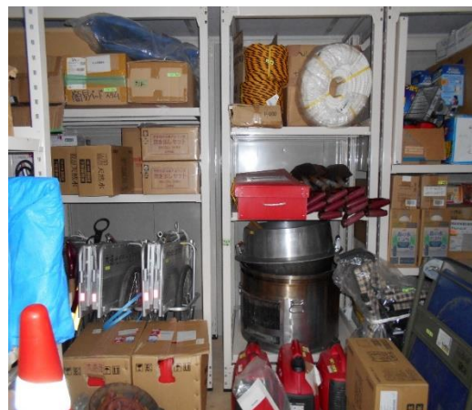
大通地域生活センター玄関右側防災倉庫内