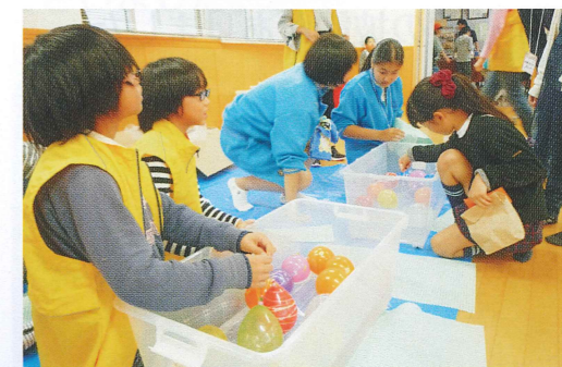
【大通小学校、白根北中学校、白根高校の生徒もスタッフとして参加しました】