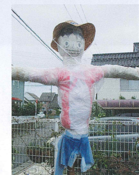
【かかしコンテスト第1位】