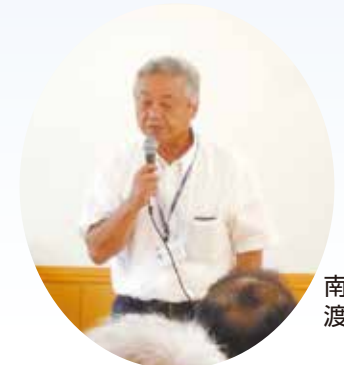
南区 渡辺 稔 区長