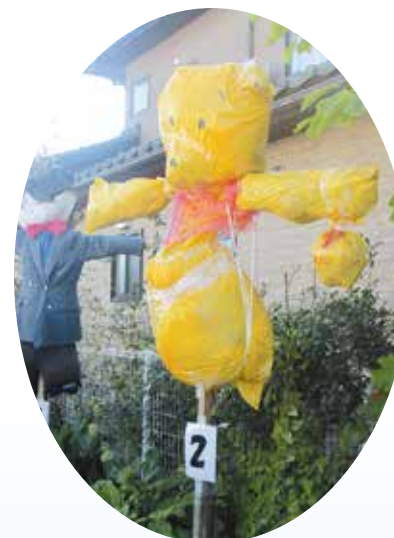
【かかしコンテスト 第1位】

シャトルバスはいかがでしたか?「ちょっとした遠足気分も味わえ、便利でした。」という感想もいただきました。キッズダンスや空手の披露も好評でした。運営スタッフとしてご協力いただきました皆様、そして白根高校や白根中学校、大通小学校の生徒さんも、ボランティアとしてお手伝いいただき誠にありがとうございました。さまざまな年代の皆様が集まり、笑顔で楽しい一日を過ごすことができました。