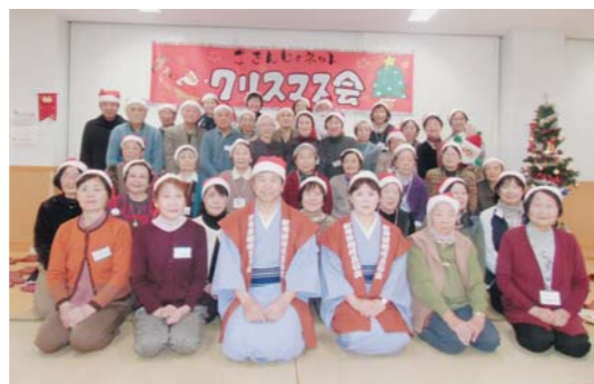
12月26日 クリスマス会

こんにちは！地域の茶の間「ごきんじょネット」です。 月二回、第二・第四水曜日10時～11時30分、 大通地域生活センターで、50歳代～90歳代が 参加しています。 参加費は100円で、おしゃべり・体操・手話歌・ お茶・その他諸々で楽しんでいます。 バスでお出かけ・秋を楽しむ会・クリスマス会も行います。 まずは、100円を持って第二・第四水曜日、大通地域生活センターへお越しください。 100円(縁)で楽しい縁をつくりましょう。ただいま参加者、大・大募集中です。 問い合わせは「ごきんじょネット」代表 長谷川090-3577-2144までお願いします。