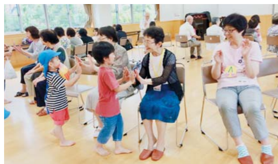
6月27日 大通保育園児との交流