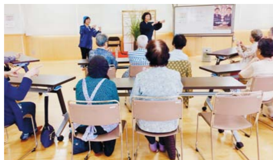
9月12日 秋を楽しむ会